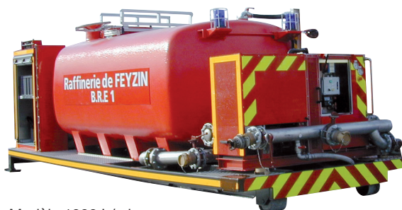
Modèle 1000 L/min