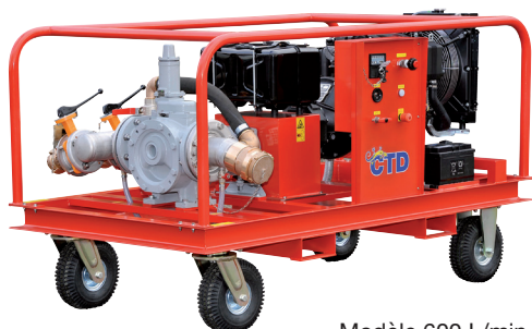
Modèle 600 L/min